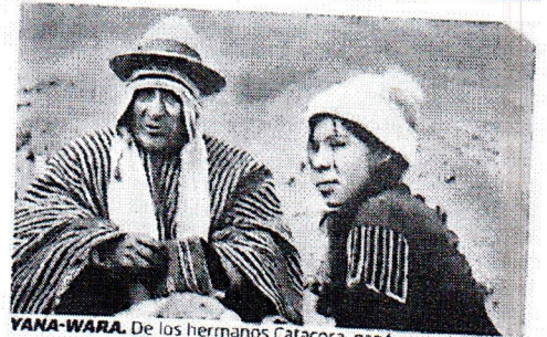
YANA-WARA. De los hermanos Catacora, ganó como la mejor película peruana, la mejor dirección y el mejor guion.

Además, se otorgó el Premio Emérito Armando Robles Godoy a la trayectoria cinematográfica a Nora de Izcue, en reconocimiento a su destacada contribución al cine peruano. Estos premios reflejan el compromiso continuo con la representación y la narración de historias auténticas y diversas que reflejen la riqueza cultural del Perú.